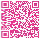
Annuaire Périnatal Réunion

• VIF - violences intra-familiales : tous les documents utiles au dépistage et à la prise en charge des VIF sont à retrouver sur notre site www.repere.re espace Professionnel